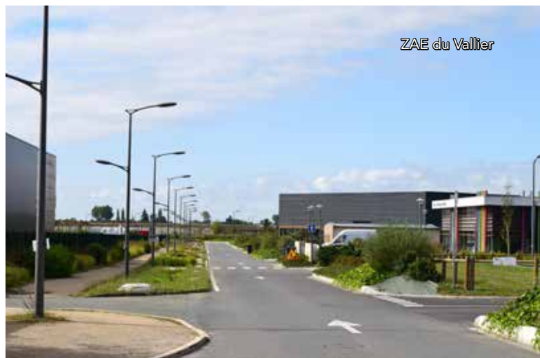
ZAE du Vallier

Urbanisation Mandela-Fouré : La municipalité souhaite réaliser sur ce secteur des aménagements urbains d'intérêt général, maîtriser la gestion foncière et contrôler son urbanisation.