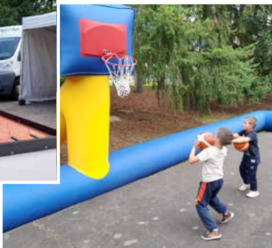
Le 2 septembre , les Mainvillois ont pu découvrir la Fête du sport et de la culture au parc des Vauroux.