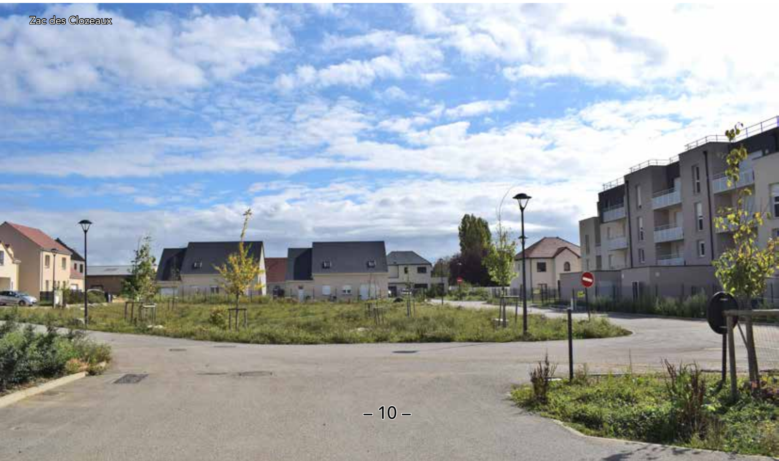
Zac des Clozeaux

Pour rappel, pour toute réalisation de travaux, vous devez déposer une autorisation d'urbanisme en favorisant la voie dématérialisée via la plateforme e-permis.