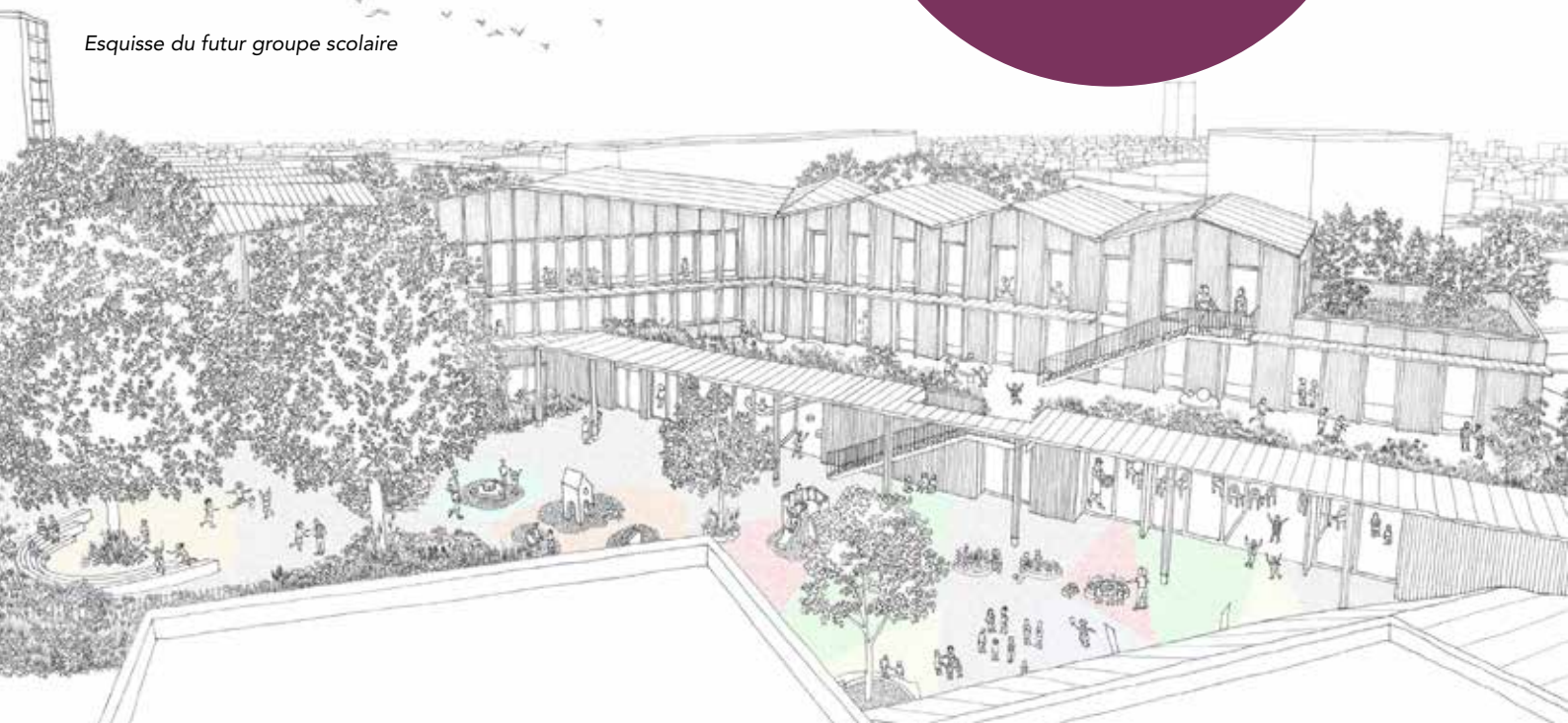
Esquisse du futur groupe scolaire