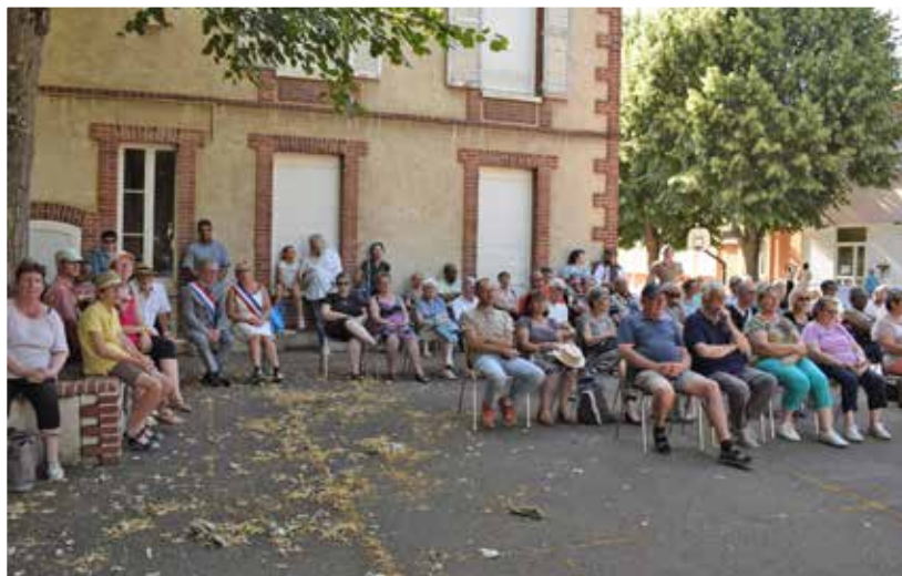
Le 14 Juillet , Fête Nationale dans la cour de l'école Emile Zola.