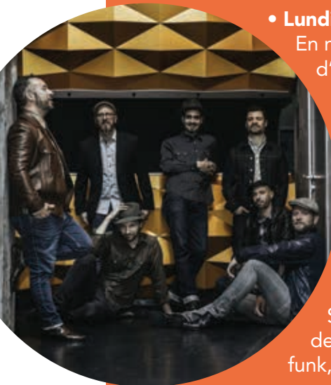
Malted Milk