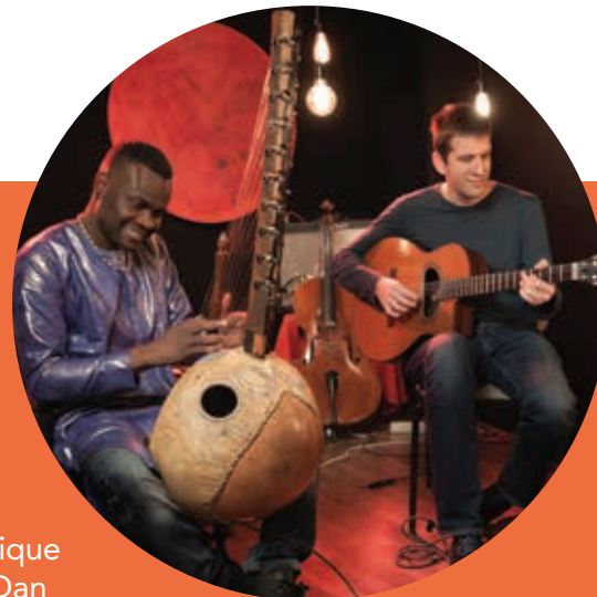
African variations duo

* Présence du public au conseil municipal autorisée sans présentation du pass sanitaire. Port du masque obligatoire. Respectez les gestes barrières.