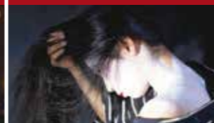
« SILENCE »

Rendez'vous culturels à Mainvilliers Printemps - Été 2022