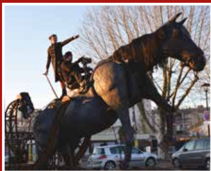
Festivités de Noël