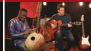
AFRICAN VARIATIONS DUO