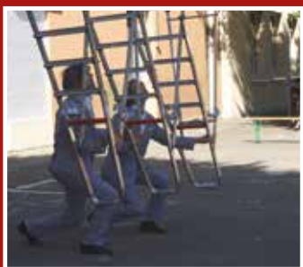
Fête nationale du 14 Juillet