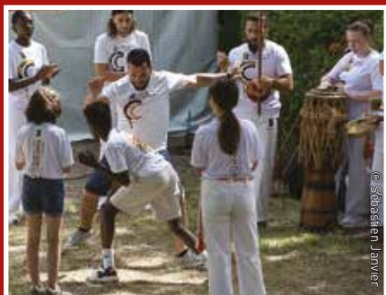
Fête de la Saint-Hilaire