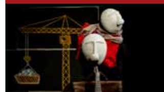
« JEU »