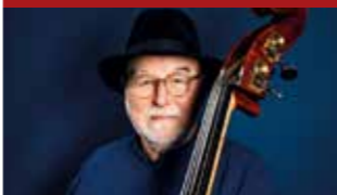
HENRI TEXIER TRIO

Rendez'vous culturels à Mainvilliers Printemps - Été 2023