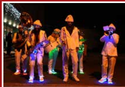
Festivités de Noël