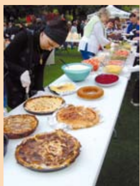
Plus de 500 personnes (artistes, organisateurs, spectateurs confondus) ont partagé un repas convivial.