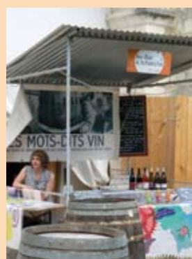
Les nappes du Festival, réalisées par des habitants de Mainvilliers ont voyagé dans chacune des 8 villes étapes du festival régional.