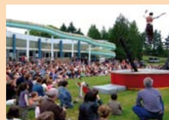
Locomotivo : un des nombreux spectacles proposés dans le cadre du festival Excentrique.