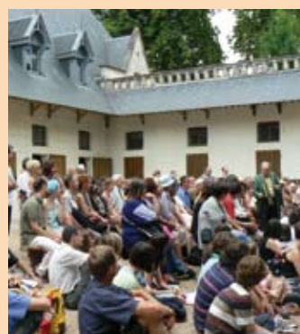
Un bus mis à disposition par la ville le 29 juin dernier a permis à une trentaine de Mainvillois de participer à la 8 ème étape du Festival à Chaumont-sur-Loire.