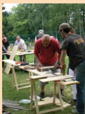
Hortus Bitum : 12 personnes de tout âge ont contribué à l'élaboration du mobilier pour le jardin amené à évoluer à chaque étape du Festival.