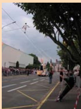
Traversée de l'avenue par un funambule avec le soutien des associations sportives et culturelles venues prêter main forte ; le tout rythmé par le slam.